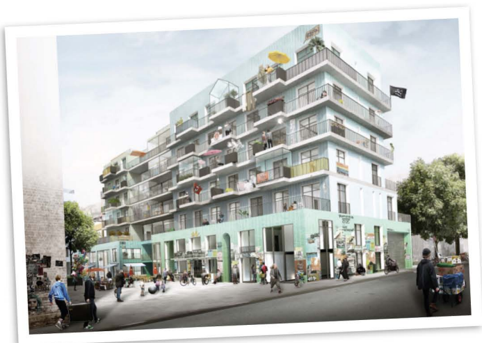
Baugemeinschaft mit Subkultur-Cluster feld72