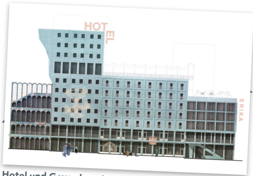
Hotel und Gewerbe mit Stadtbalkon (Spielbudenplatz) NL/BeL

Ist das Gelände fertig, können Sie durch die neue Gasse zwischen den Häusern schlendern und die Vielfalt dort entdecken, auf den Dächern spielen oder auf dem Stadtteilbalkon den Tag genießen.